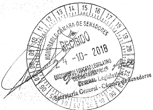
Jorge Querey Senador de la Nación