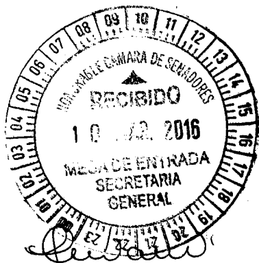
Fernando Lugo Senador de la Nación