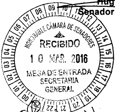
Fernando Lugo Senador de la Nación