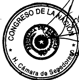
Adolfo Ferreiro Senador de la Nación

Sin otro particular hago propicia la ocasión para saludarle con la más alta y distinguidas consideración.