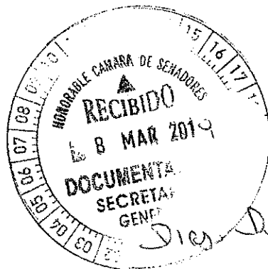
Jorge Querey Senador de la Nación