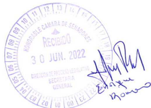
Sergio Godoy Senador de la Nación