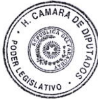
Miguel Jorge Cuevas Ruíz Díaz Presidente H. Cámara de Diputados