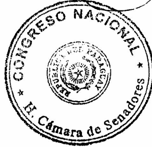
Mario Abdo Benítez Presidente H. Cámara de Senadores