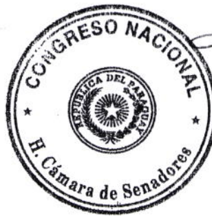
Fernando Lugo Méndez Vicepresidente 1º En ejercicio de la Presidencia H. Cámara de Senadores