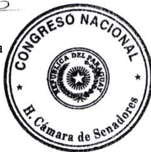
Fernando Lugo Méndez Vicepresidente 1° En ejercicio de la Presidencia H. Cámara de Senadores

A Su Excelencia Pedro Alliana Rodríguez , Presidente Honorable Cámara de Diputados Poder Legislativo