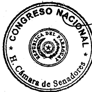
Mario Abdo Benítez Presidente H. Cámara de Senadores

A Su Excelencia Hugo Adalberto Velázquez Moreno , presidente Honorable Cámara de Diputados Poder Legislativo