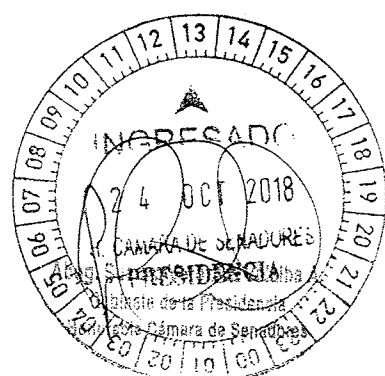
Jorge Querey Senador de la Nación