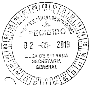
Jorge Querey Senador de la Nación