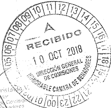
ABEL GONZALEZ Abel González Ramírez Senador de la Nación