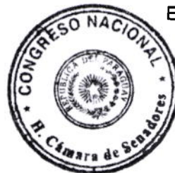
Sixto Pereira Galeano Vicepresidente 1º En ejercicio de la Presidencia H. Cámara de Senadores