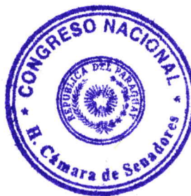
Sixto Pereira Galeano Vicepresidente 1º En ejercicio de la Presidencia H. Cámara de Senadores