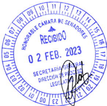
Pedro Arturo Santa Cruz Insaurralde Senador de la Nación

Sin otro particular, lo saludo con el mayor respeto y consideración.