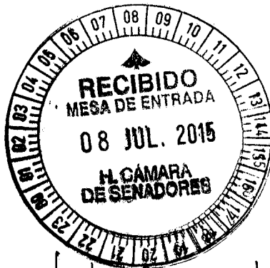
Victor Brasnovec H. Cámara de Senadores